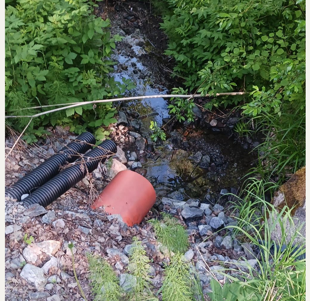
Mäkikadun ja Naistenmatkantien välinen luonnontilaisen kaltainen osuus (nro 2), jonka putkitus katkaisee sekä ylä- että alaosasta