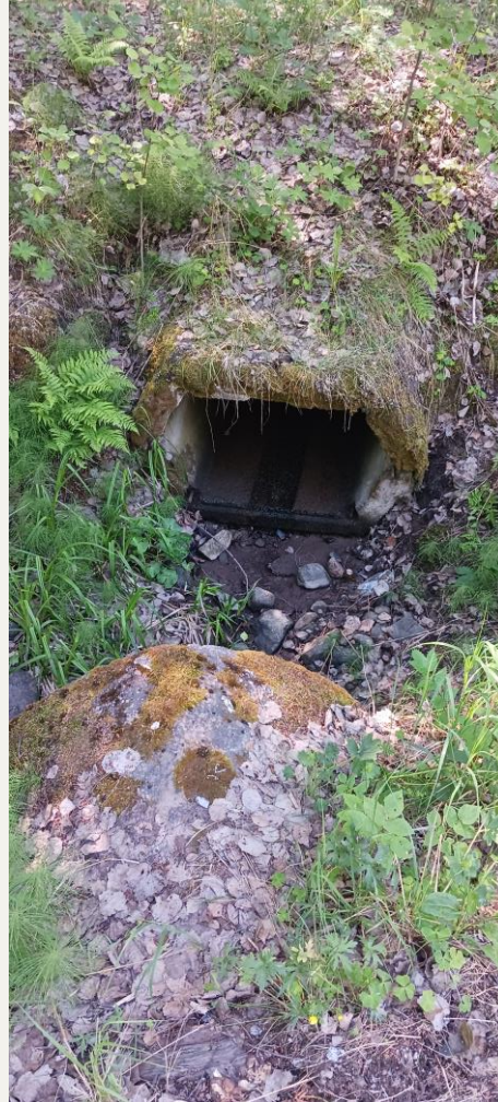
Putkitus Mäkikadun alitse