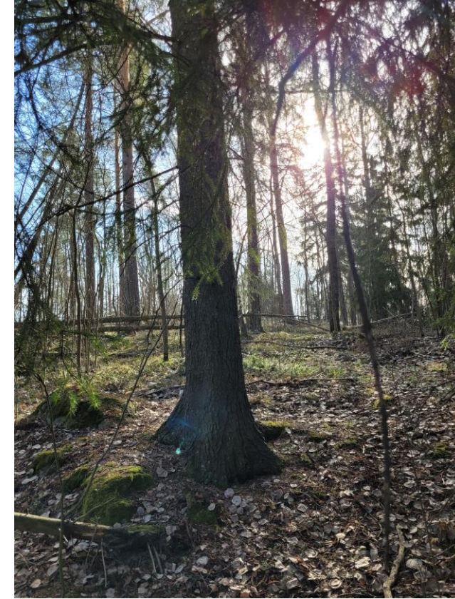
Alueella on muutamia isompia haaparyhmiä sekä joitain isompia kuusia.