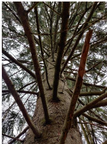
Järeä kuusi länsiosan metsäalueella