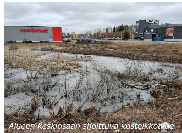
Alueen keskiosaan sijoittuva kosteikkoalue