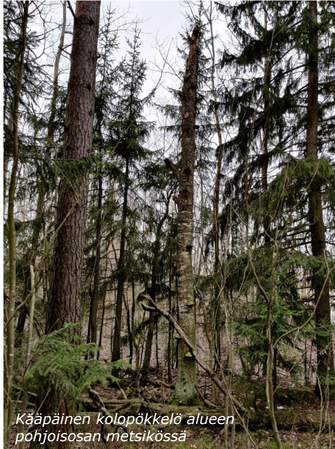
Kääpäinen kolopökköalueen pohjoisosan metsikössä