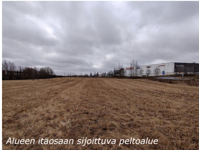
Alueen itäosaan sijoittuva peltoalue