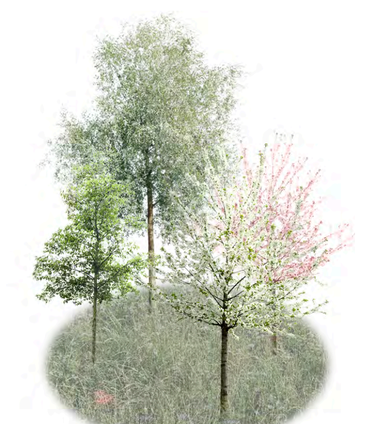
NIITYT JA KORISTEPUUT: paikalliset niittykukat ja heinät sekä kukkivat puut