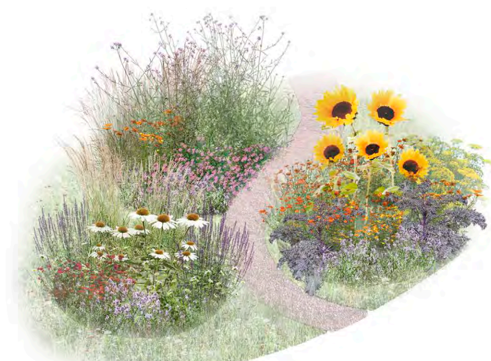
AISTIPUUTARHA: perennat/tuoksuvat ja syötävät koristekasvit/1- ja 2-vuotiset kukat