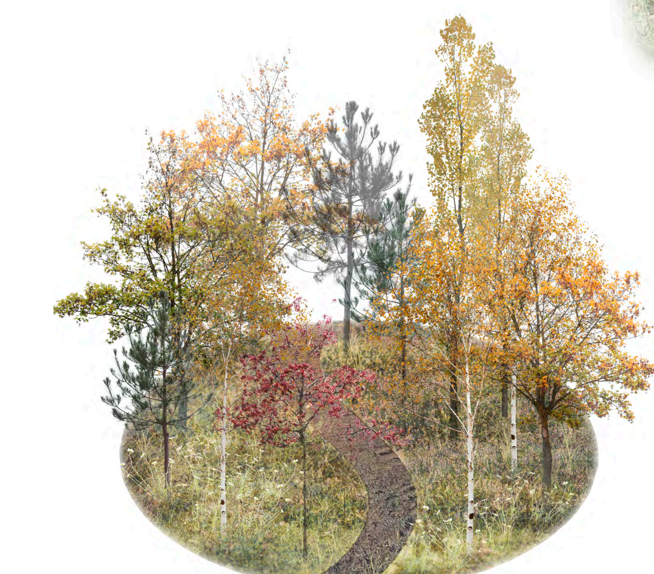
MIKROMETSÄ: Luonnonsuojelualueelta löytyviä puulajeja sekä itse muodostuva pohjakasvillisuus