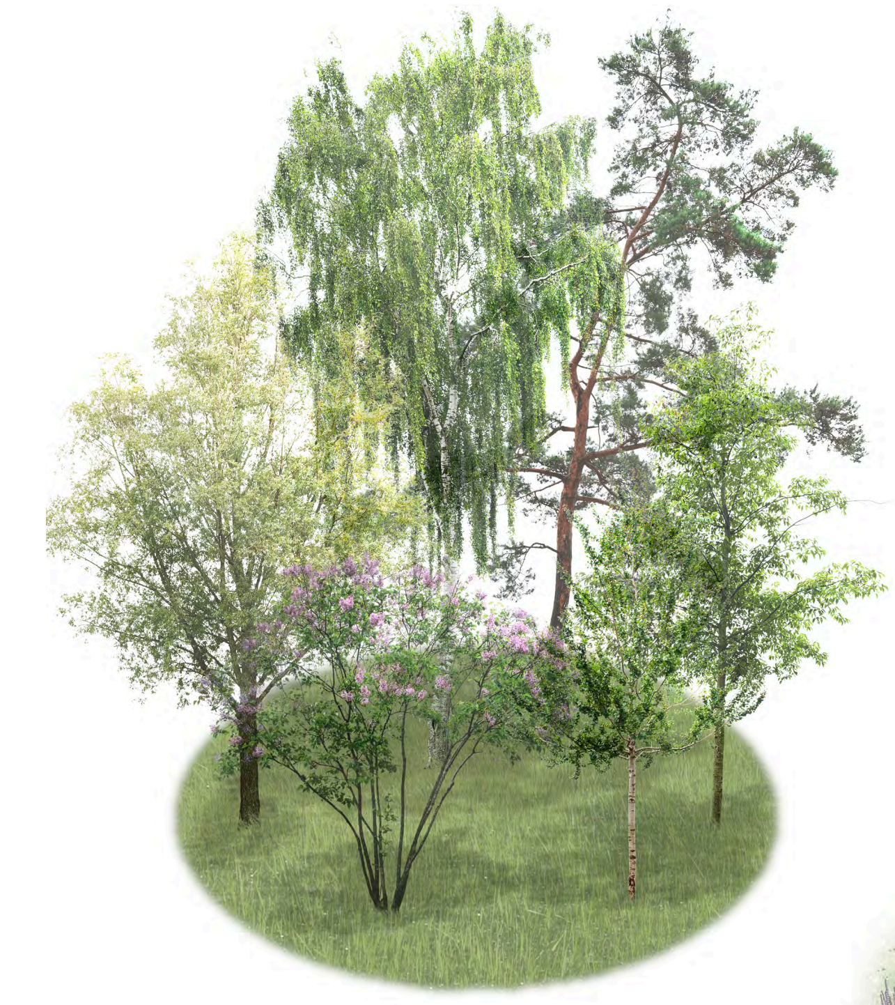
OLEVAT PUUVARTISET KASVIT JA NURMI

Puiston eteläreunan nurmialue metsetetään mikrometsäksi. Mikrometsä, oleva puusto ja rantakasvillisuus toimivat suojavyöhykkeenä ja porttina Vuorenhän luonnonsuojelualueelle. Mikrometsään tehdyt polut ja aukeat tarjoavat veistospuistolle vaihtuvien näyttelyiden tilan.