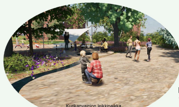
KURIKANVAINION LEIKKIPAIKKA 1:500